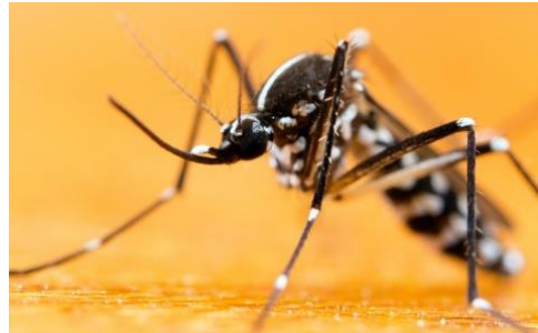
Photographie d'un moustique tigre, Aedes albopictus .

Il est source de nombreuses nuisances. Parmi celles-ci, il est notamment capable de transmettre des virus tels que ceux responsables de la dengue, du chikungunya et du zika : on parle d'arboviroses, c'est-à-dire de maladies contractées par des virus transmis par piqûres d'arthropodes (moustique, moucheron piqueur, tique) à des hôtes vertébrés (mammifères ...).